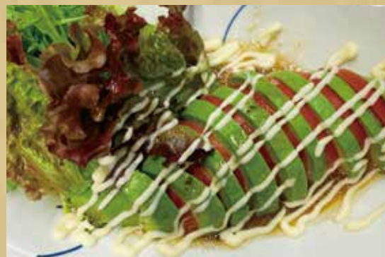
アボガドとトマトのサラダ