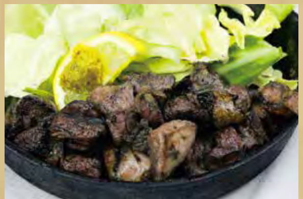
ちどりの炭火焼 (ハーフ)