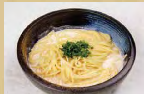
明太クリームパスタ