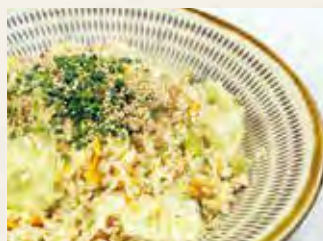
塩レタスチャーハン