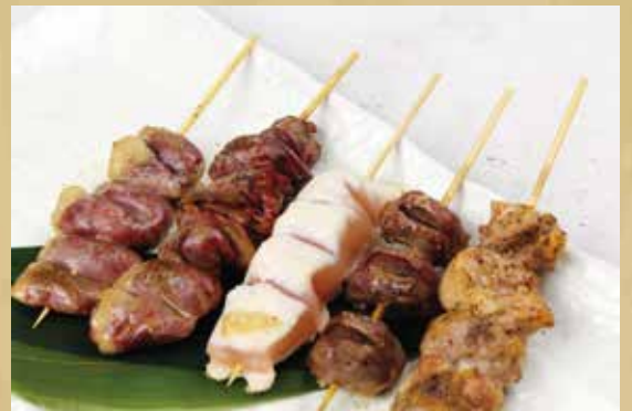
左からハツ串、レバー、ささみ、砂ズリ、鶏もも

※人気商品のため売り切れの場合がございます。また、連休中など入荷が無い場合もございますので、ご了承ください。持ち帰りの際は容器代として別途2%いただきます。