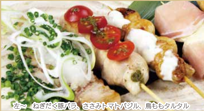
左〜 ねぎだく豚バラ、ささみトマトバジル、鳥ももタルタル