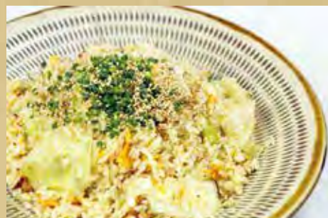
塩レタスチャーハン