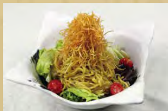
ラーメンサラダ・・・シャキシャキの野菜、つるつるの麺、千切りジャガイモのフライ、いろんな食感が楽しめる！！