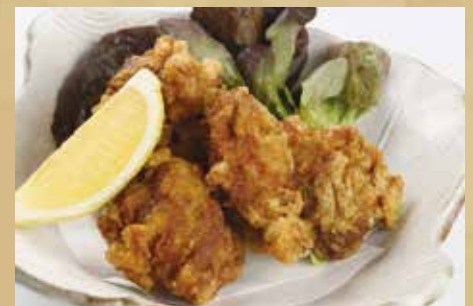
とりももの唐揚げ