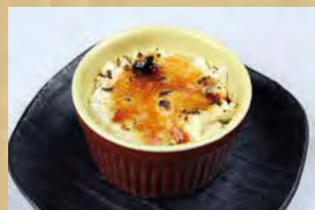
なめらか生プリン