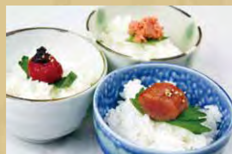
ごはん(鮭・梅・明太・鮭マヨ)