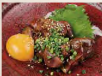
鳥肝のちよい焼き